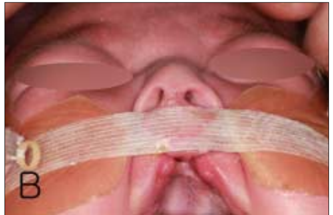
Fig. 5. Extraoral views of patient A on the second(A) and fifth(B) moldings.