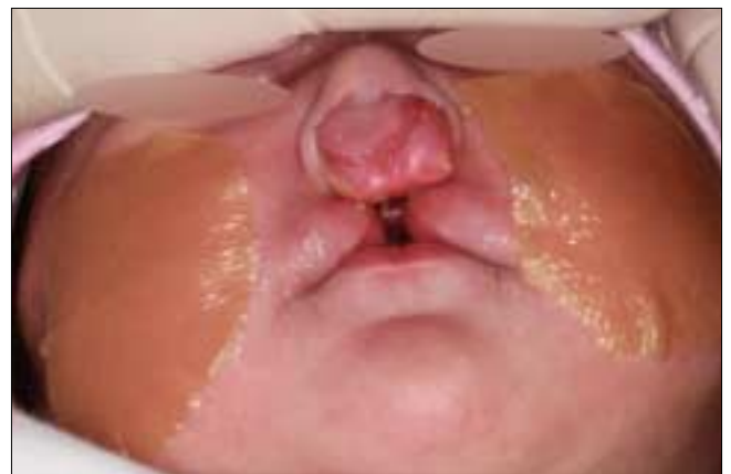
Fig. 1. Bilateral cleft with absent columella, wide nasal tip, protruded premaxilla, and separated lip segments.

K-NAM 장치물 제작과정은 다음과 같다. 인상 채득 후 얻어진 석고모형의 언더컷 부위를 왁스로 블록아웃(block out)하였으며 A의 경우 구개열이 동반되어 있어 구개부 파열 부위도 포함시켰다. 분리재 도포 후 교정장치 제작용 레진 및 호선(0.8 mm)을 이용하여 레진판, 2개의 유지부(retention arm), 2개의 비부(nasal arm)로 구성된 K-NAM 장치를 제작하였다. 비부의 끝부분에는 레진볼을 작게 형성해주고 이후 비정형시 조직양화제(tissue conditioner)를 첨가하는 부위로 사용된다. 유지부의 호선 끝은 둥글게 고리를 형성하여 교정용 고무줄을 걸 수 있게 하며 이 고무줄에 스테리스트립(Steri-Strip™, 3M, USA)을 연결하여 환아의 협부에 장치물을 부착시켰다. 레진판의 후방 경계는 경구개와 연구개의 경계부위로 하여 장착시 환아가 구역질을 하지 않도록 하였다. 레진판의 조직면에 조직양화제를 도포하는데 이는 치조골 정형의 목적 뿐만 아니라 조직을 보호해주는 역할도 한다(Fig. 4A). 이후 비부의 끝부