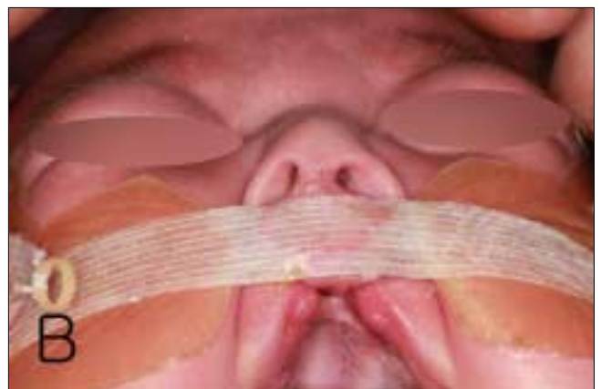
Fig. 4. (A) The K-NAM(K-nasolaveolar molding) appliance for bilateral cleft. (B) Patient with the elastic band and K-NAM appliance.