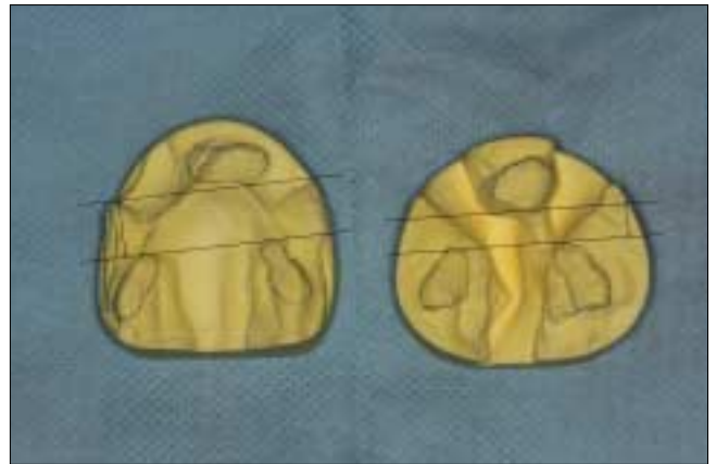
Fig. 8. Dental models of patient B taken on the first visit(Left) and after presurgical nasolabial molding procedure(Right). Note that the previously protruded premaxilla has been migrated backward.