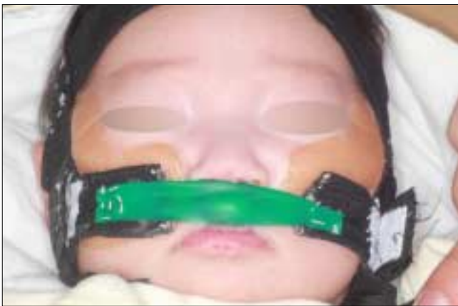
Fig. 3. A patient with a rubber band and head cap.

위가 콧구멍에 들어가도록 비부 호선을 조정하고 레진볼에 조직양화재를 쌓아 올려 코끝을 전상방으로 밀어내며 비소주에 신장력이 가해지도록 위치시켰다(Fig. 4B). 보호자에게 장치물의 장착 및 제거 방법, 주의사항을 교육시키고 약 1주일 간 장치물을 장착한 상태로 수유와 생활에 잘 적응하는지 여부, 구강 내나 비강 내에 염증이나 부종이 생기는 부위가 없는지 확인한 후 과도하게 압박되는 부위는 조정해주었다. 이 후 1주일 간격으로 내원시켜 K-NAM 장치물의 비부 끝에 조직양화재를 쌓아 올려 비정형을 시행하였는데, 이 때 코끝이 약간 하얗게 될 정도의 높이가 적절하다. 또한 레진판 조직면에는 조직양화재를 첨가 및 선택적 삭제하여 치조 분절의 정형도 함께 시행하였다.