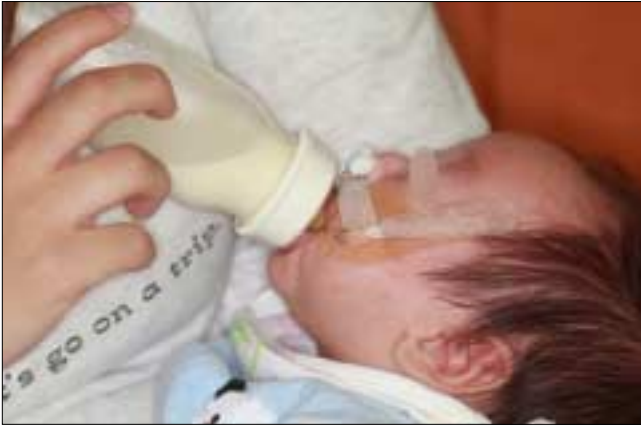
Fig. 11. Patient B, bottle feeding with K-NAM appliance.

인해 비대칭적인 코의 형태가 주된 특징이므로 이환된 쪽의 낮아지고 옆으로 평평해진 코의 형태를 반대측과 대칭성을 이루게 하는 것에 주안을 둔다. 그에 반해 양측성 구순/구개열 환자의 매우 짧은 비소주로 인해 코끝이 납작하고 전순과 전상악골이 전방변위 되어 있는 것이 특징이다. 이로 인해 술전 비치조정형 장치를 장착할 수 없는 경우 탄성밴드를 이용하여 전방 변위된 전상악골을 후방 이동시키면서 장치물이 들어갈 수 있는 공간을 마련하는 과정이 먼저 필요하다. 이 후 짧은 비소주를 신장시키고 납작해진 비첨의 위치를 높게 개선시키며 그와 동시에 계속적으로 전순과 전상악골을 후방전인 해주어야 한다. 따라서 장치물이 복잡해지고 장치물의 조정도 더 자주 필요하게 된다.