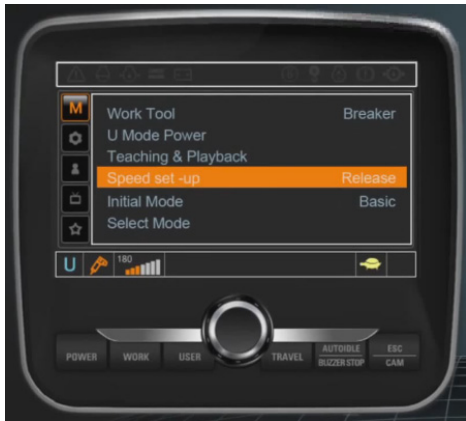
그림 2. 운전석 계기판

또한 전자비례제어밸브의 제어신호 및 압력센서등의 출력값을 비교하여 시스템 이상시 자가진단기능을 구현할 수 있으며, 또한 원격지에서 시스템을 이상을 감지하여, 고장이 발생하기 전에 미리 조치가 가능하다.