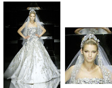
〈그림 3〉 2008, Elie Saab