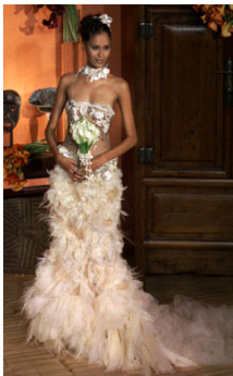
〈그림 4〉 2002, Ungaro - www.style.com

21세기로 들어서서는 여러 문화권과 다양한 문화계층에 대한 관심이 패션경향으로 나타나면서 웨딩드레스 스타일에도 민속적 스타일이 등장하고 있다. 민속적 스타일에는 아시아의 에스닉이미지는 물론 포클로와이미지, 아프리카풍의 원시적이미지등이 독창적인 웨딩드레스 스타일로 표현되었다. 〈그림 8〉 26) 은 Lanvin의 작품으로 농가적 풍경이 연상되는 포