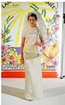
<그림 8> 2009, Lanvin

2000년대 컬렉션에 등장한 웨딩드레스 스타일의 또 다른 특징은 기존의 웨딩드레스 디자인 개념에 상반되는 아방가르드적 표현이다. 이는 세계적인 컬렉션을 주도하는 오프구띠르 디자이너들의 독창적인 표현에 대한 의지와 전통적이고 귀족적인 형식에 치우친 웨딩드레스 스타일에 대한 안티적 감성에 비롯된 것으로 보인다. 아방가르드적인 웨딩드레스 스타일은 기존의 웨딩드레스의 개념은 물론 형태, 소재, 색상에 이르기까지 발상의 전환을 보여주는 디자인으로 주로 Yves Saint Laurent, Chanel, Christian Dior, Jean Paul Gaultier, Christian Lacroix, Vivienne Westwood 등 세계적인 톱 디자이너들의 웨딩드레스 컬렉션에서 나타났다. <그림 12> 30) 는 Christian Dior 작품으로 조화로운 웨딩드레스 착용 개념을 무너뜨리는 조합으로 우아한 웨딩드레스에 밀리터리룩의 카키색 바지를 코디네이션하여 거친 캐주얼이미지를 연출하고 있다. 웨딩드레스 스타일과 안티 패션을 조합한 아방가르드적 표현이라 할 수 있다. <그림 13> 31) 은 Givenchy의 역사적 드레스가 조화된 웨딩드레스 스타일로 그동안의 웨딩드레스에서 사용하지 않는 가죽소재를 사용하여 아방가르드적인 퓨처리스틱이미지를 보여준다. <그림 14> 32) 는 Alexander Mcqueen의 작품으로 사슴뿔을 연상하는 초현실적 머리장식과 메이크업 그리고 동물의 스킨을 상징하는 듯한 소재사용으로 현실을