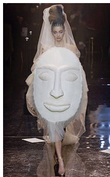
<그림 9> 2005, Gaultier