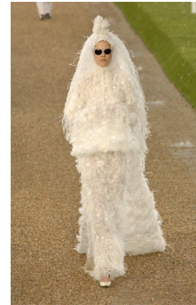
<그림 15> 2007, Chanel - www.style.com

초월한 다른 세상을 신비적으로 표현하고 있다. <그림 15> 33) 는 Chanel의 작품으로 모피처럼 보이게 연출된 싸구려 비닐소재로 만들어진 키치이미지의 웨딩드레스 스타일이다. 실루엣도 웨딩드레스 스타일과는 상반되는 온몸을 감싸는 오벌형으로 이루어졌으며 흰 색상만으로 기존의 웨딩드레스 스타일을 상징하고 있다. 그리고 전혀 어울리지 않은 선글라스의 조합으로 유머스런 분위기를 연출하였다. 이처럼 2000년대의 웨딩드레스 스타일의 이미지는 새로운 미학적 접근으로 이전에 볼 수 없었던 조화로운에 대한 개념적인 한계를 무너뜨리고 새로운 시도를 통한 디자인의 무한한 확장을 가져오고 있다.