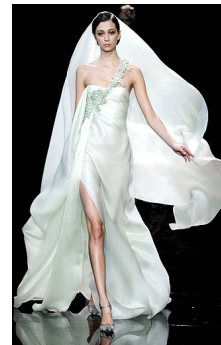
〈그림 7〉 2007, Armani