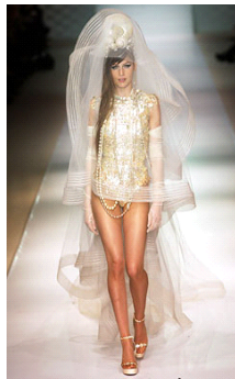
〈그림 5〉 2003, Gaultier