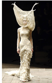
<그림 14> 2006, Mcqueen