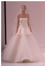
〈그림 1〉 2000, Vera Wang

이처럼 기존의 2000년대 웨딩드레스 스타일은 전형적인 틀을 깨 이미지로 다양한 실루엣, 소재를 사용하고 헤어, 메이크업의 새로운 스타일을 창조하고 있으면서도 각각의 이미지에 어울리게 토털 코디네이션 연출을 하고 있었다.