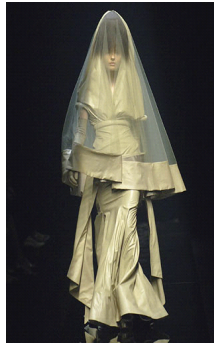
<그림 13> 2006, Givenchy