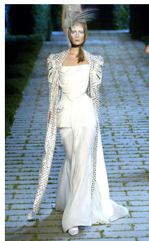
<그림 10> 2006, Dior