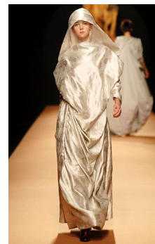
<그림 11> 2007, Westwood