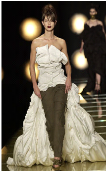
<그림 12> 2002, Dior