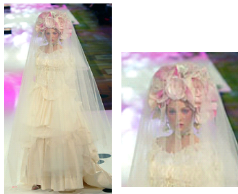
〈그림 2〉 2003, Lacroix