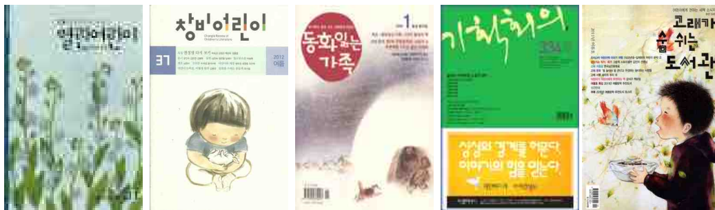
<그림 2> 2000년대 전반기 신규 발행된 서평 제공 잡지

이외에 이 시기의 주요 특징으로는 인터넷 서점의 독자서평 블로그가 운영되어 어린이 도