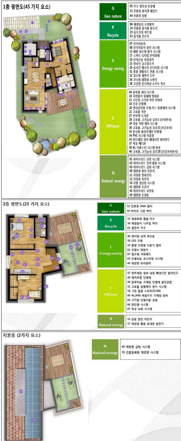
그림 3. 모니터링 프로젝트 구성요소 Fig. 3. Component of monitoring project