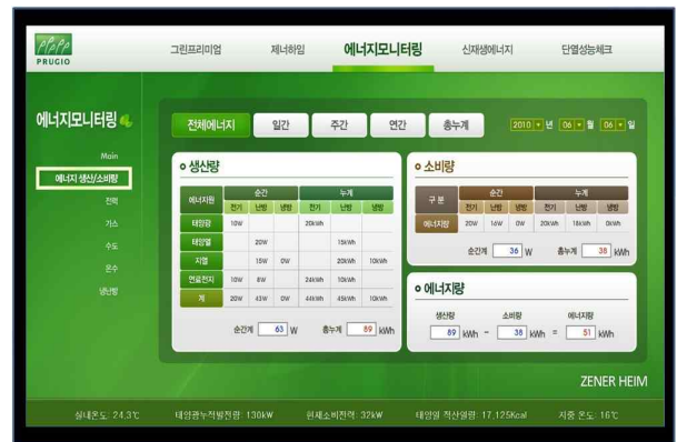
그림 4. 실시간 에너지 모니터링 시스템 Fig. 4. Real-time Energy Monitoring system

본 모니터링 프로젝트는 2010년 9월부터 2012년 12월까지 27개월간에 걸쳐 실시간 에너지 모니터링 시스템[1-2]을 이용하여 모니터링을 실시하였다. 실시간 에너지 모니터링 시스템은 스마트분전반, 스마트전력량계, 원격검침, 태양광, 태양열, 지열, 연료전지 시스템의 순간 및 누적에너지 변화량을 TCP/IP, RS-485 통신 등을 이용하여 모니터링, 통계화하여 실시간으로 보여주는 시스템을 말한다.