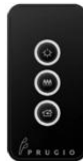
그림 7. 센서 감지형 무선 일괄제어 시스템 Fig. 7. Wireless Sensor type batch control system