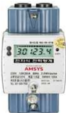
그림 9. 스마트 디지털 전력량계 Fig. 9. Digital Smart Meters

관련 부하는 연료전지 가동을 위한 도시가스 및 연구목적의 에너지모니터링에 필요한 전력과 전시관 운영 목적으로 적용된 일부 설비이다. 당초 설계 대비 62% 소비량 절감을 하였으나, 주된 원인은 연료전지 가동 중단으로 인한 도시가스 소비가 없었다. 더불어 에너지 생산 및 사용을 지속적으로 모니터링하는 실시간 에너지모니터링 시스템과 당사에서 개발한 스마트 디지털 전력량계[1-2]를 적용하여 세대내에서 사용하는 에너지의 변화를 관측하여 feedback 한 것도 에너지 사용량을 계획 대비 적게 사용한 결과가 되었다. 스마트 디지털 전력량계는 가정에서 생산 및 소비하는 전기를 양방향으로 관측하여 누적 전력량 표시하여 주는 전력량계이다.