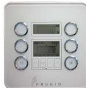
그림 8. 대기전력 차단 스위치 Fig. 8. Standby power shut-off switch