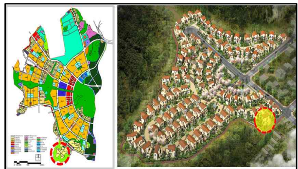
그림 1. 모니터링 프로젝트 배치도 Fig. 1. Plans of monitoring project