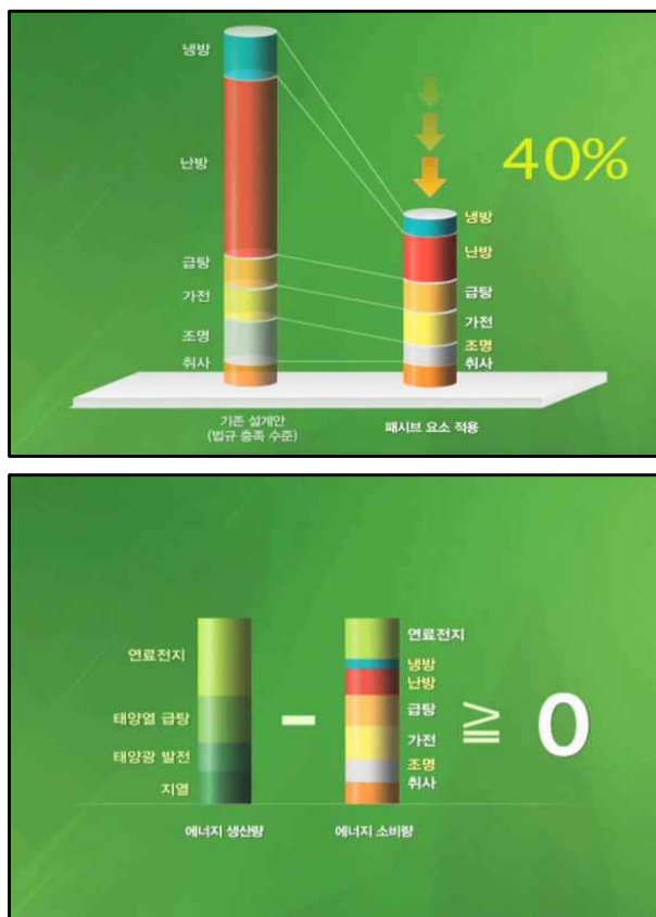
그림 2. 제로 에너지 하우스 개념 Fig. 2. Concept of Zero Energy House

하지만 액티브 요소는 패시브 요소에 비해 설치비용이나 유지보수 비용이 높아, 제로 에너지 하우스를 달성하고자 하는 경우에는 패시브 요소를 최대한 활용하여 부하를 최소화하고, 나머지를 액티브 요소로 충당하는 계획 및 설계가 필요하다.