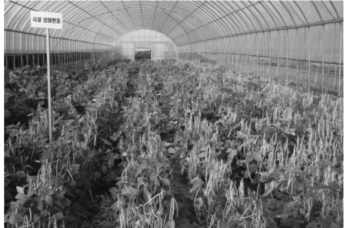
Fig. 3. Appearances of intermediate-erect type cowpea genotypes at ripening stage in plastic greenhouse.

체 당 착협수, 백립중과 수량 간에는 고도의 정의 상관관계가 있고(Kim et al. , 1985), 동부의 수량에 관여하는 주요형질은 주당협수, 주당립수, 백립중(Chang and Sung, 1979)이라는 보고와 유사하였다.