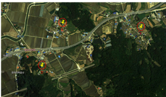
Figure 2. Sampling sites in Dogo myeon, Asan city

에서 백석면이 함유된 것으로 확인된 슬레이트 지붕을 가진 20가구를 대상으로 조사한 선행 연구(Jang et al., 2013)에서 석면 함유 농도가 높았던 6곳을 선정하여, 각각 다른 4~7번의 맑은 날에 공기시료를 채취하였다. 조사 대상지역의 시료 채취지점을 Figure 1과 2에 나타내었다.