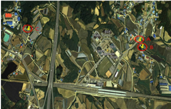
Figure 1. Sampling sites in Sinchang myeon, Asan city