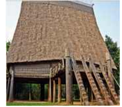
<그림 3> 바나족전통주거

근대 이후 도시주택의 대표적인 유형인 튜브하우스는 1900년 이전에 건축된 경사지붕 형태의 1-2층 목조주택의 튜브하우스(냐옹), 20세기 전반의 프랑스 식민건축양식 영향으로 벽돌과 타일을 사용한 근대적 양식의 튜브하우스, 20세기 중반(독립)이후부터 도이며이 정책의 일환으로 도시정비가 되면서 전면은 밝은 색채의 페인팅 마감과, 프랑스 건축의 개구부 디자인과 몰딩이 적용되고 고층화된 형태로 점차 발전 8) 하게 되었다.