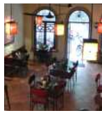
<그림 15> 현대적인 철제의자