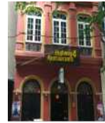
<그림 8> 프랑스풍 파사드