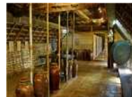
<그림 4> 에데족 전통주거 실내

열대우림기후에 위치한 베트남은 전통적으로 다양한 자연재료를 이용하여 지은 토속적인 내부공간을 형성하였는데, 진흙을 발라 벽을 마감하거나 짚이나 대나무<그림 4>, 라탄 등의 재료로 스크린, 창 덮개, 바닥 매트 등을 만들었는데 짜여진 다양한 패턴으로 베트남만의 스타일을 연출해냈다. 또한 내부 기둥에는 거북이, 용 등 신성한 동물이나 꽃, 구름 등을 조각<그림 5>하여 주술적인 의미를 표현하였다.