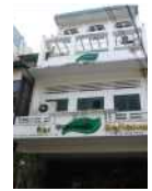
<그림 9>현대적인 튜브하우스 파사드