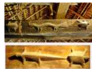
<그림 5> 에데족 전통주거 기둥조각