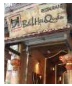
<그림 7> 베트남 전통특성 파사드

간판은 레스토랑을 찾는 고객들에게 상호를 알려주거나 레스토랑 취급음식 및 유형에 대한 정보를 주기 위한 기능 외에도 고객을 끌어들이는 역할을 한다. 그러나 조사대상 레스토랑의 경우 베트남 고유의 특성을 보여주는 현판과 장식, 베트남어 글씨로 독특한 이미지를 보여주는 3사례(사례 6,11,12)외에는 별다른 특성이 없고 상호만 알려주는 정도에 그치고 있었다. 구체적으로 상호를 영문으로 표기한 사례(83%, 10사례)가 베트남어 표기(2사례)보다 많았다. 상호를 영문으로 표기하더라도 베트남의 직접적인 지명을 드러낸 사례(사례 3, 10)을 제외하고서는 베트남을 연상시키는 단어는 없었다. 이는 고급 레스토랑의 경우, 베트남의 지명, 역사, 인물 등을 상호에 반영하고 공간디자인 컨셉과 연계시키는 것과 대조적이었다. 간판 재료로는 나무현판 7사례, 상호를 스카시 형태로 붙인 2사례, 어닝에 그대로 출력된 사례, 간판이 따로 없는 사례(사례 4)도 있었다.