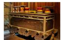
<그림 6> 바나족 실내가구 및 장식소품