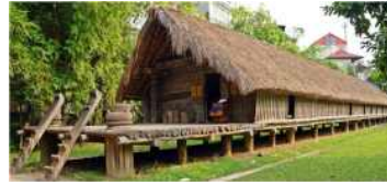
<그림 2> SeDang house architecture Nha dai Ede