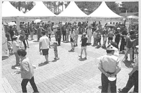
무료시식을 기다리는 행렬