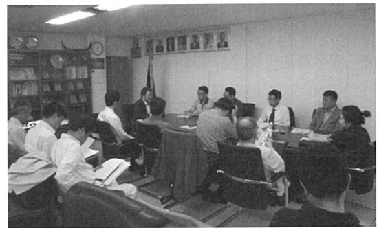
추파용 목초 및 사료작물종자 입찰심사(6.3)