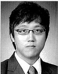
김수형 기자 축산신문

이번 기고문을 통해 소비자의 한 사람으로서 닭고기의 원산지 표시가 잘 되고 있는지 살펴보고 아쉬운 점과 개선되었으면 하는 점을 찾아보았다.