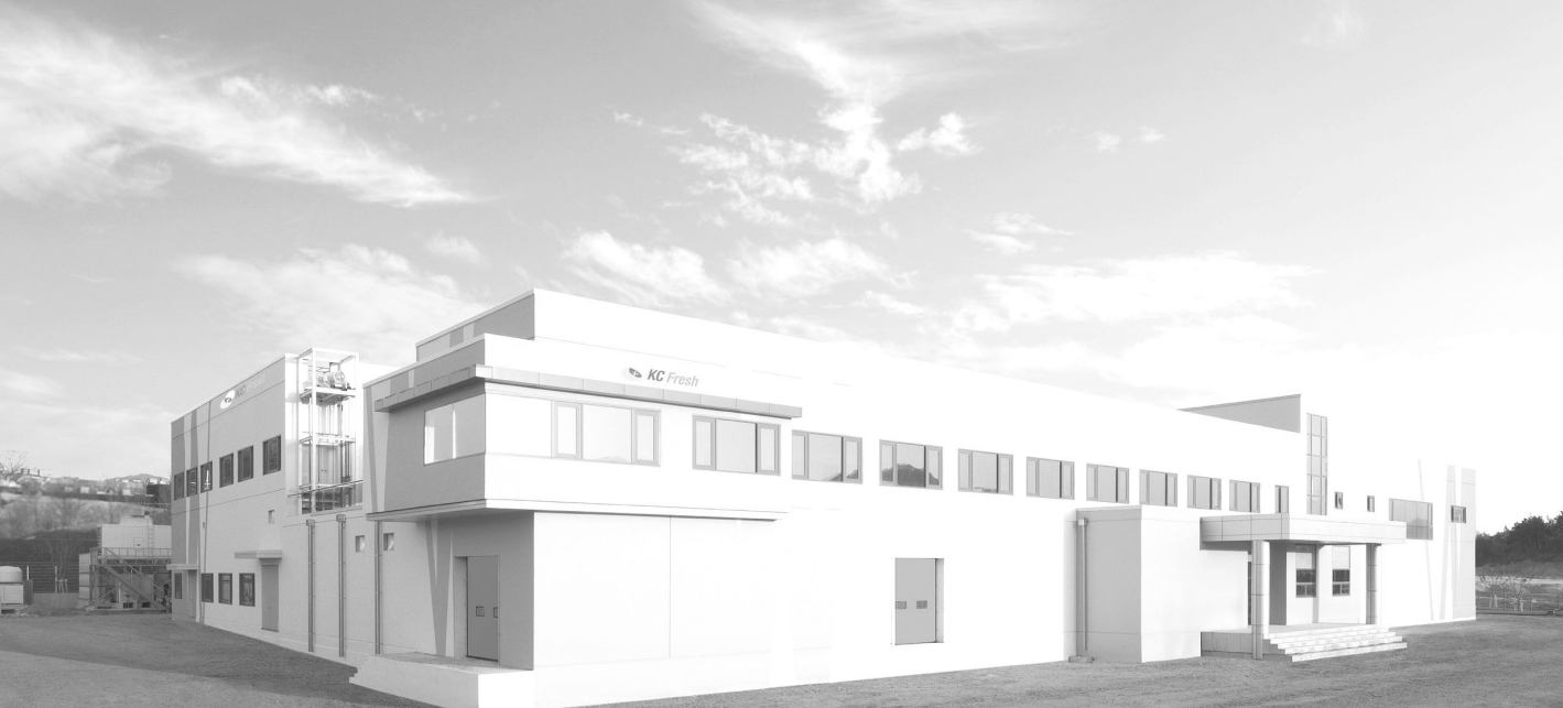
▲ 농업회사법인 (주)케이씨프레쉬 거창 계란가공장 전경

완공을 마쳤다. 그리고 금년 5월 11일 본회 이준동 회장을 비롯해 이홍기 거창군수, 조선제 거창군의회 의장, 조남조 한국사료협회 회장 등 300여명이 참석한 가운데 준공식 시작을 알렸다.