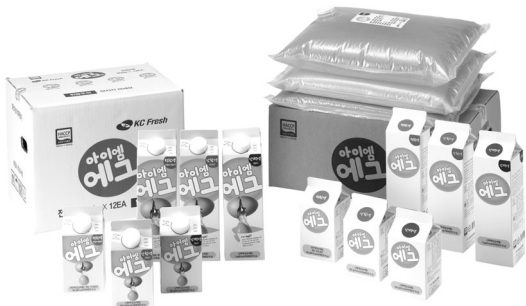
▲ 액란 제품 - 브랜드명 '아이엠에그'로 ESL제품, 살균제품, 백인박스, 벌크 등으로 판매

크게 개선해 액란의 유통기한을 30일까지 신선한 상태로 보관할 수 있는 기술력을 선보인다.