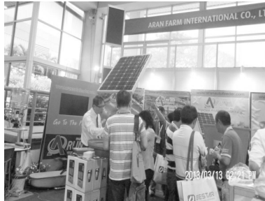
▲ 기자재 분야도 많은 관심을 보였다.

업이 어려운 때 수출의 활성화가 되는 계기가 되었으면 하는 바람과 참관 하였던 업체나 축산 농가들은 새로운 정보와 기술로 더욱 더 도약할 수 있는 기회가 되었으면 하고 소망해 본다.