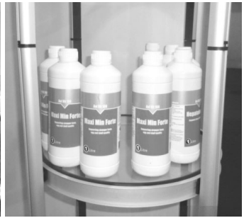
▲ Inform-Nutrition사/기능성 영양 물질로 생산성극대화 및 질병 예방