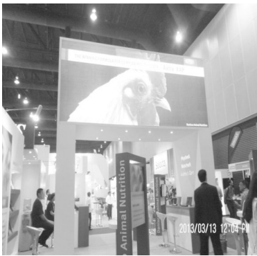
▲ 세계 각국의 다양한 축산관련업체 참가