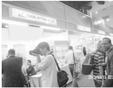
▲ 국내 참가업체-한국관