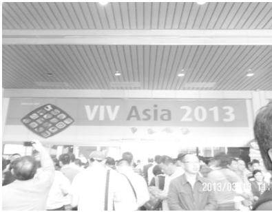
▲ 박람회장 입구