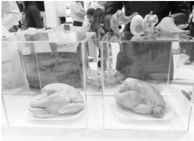
▲ 실제 제품을 투여한군과 대조군의 생닭 비교 열의