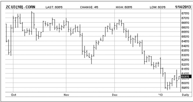
〈도표 1〉 옥수수 선물가격 동향 (9월 인도분)