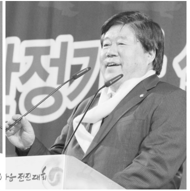
▲ 최규성 국회 농림수산물위원회 위원장