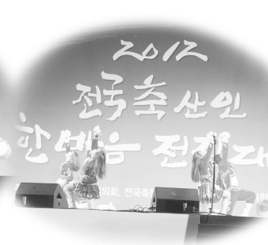
▲ 경희대학교 응원단의 식전행사