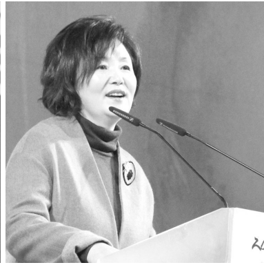
▲ 문재인 대선 후보 부인(김정숙 여사)