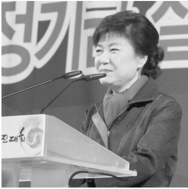
▲ 박근혜 대선 후보