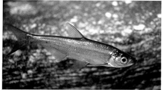
관상어 강준치 : 몸이 희어 백어(白魚)라고도 하며 그 단아한 모습에 관상어로도 인기어종으로 점차 알려지고 있다.