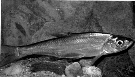
몸짱대회 출전 중? : 군더더기 없이 날씬하게 생긴 강준치