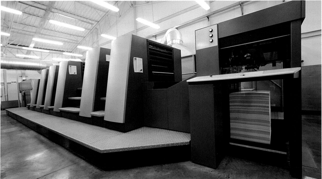
전형적인 수주업종인 인쇄산업은 개별적인 고객의 바람에 대해 대응하는 한편 현장 담당자를 통한 제조현장의 개선 작업도 추진해야 한다.

를 갖고 개선에 대한 테마를 설정할 필요가 있다. 전형적인 수주업종인 인쇄산업은 개별적인 고객의 바람에 대해 대응하는 한편 현장 담당자를 통한 제조현장의 개선 작업도 추진해야 한다. 예를 들어 제판, 인쇄, 제책 등의 다양한 부문별로 각 공정에서 필요한 개선 사항이 다양하게 나올 수 있을 것이다. TQC를 도입한 인쇄사에서는 한두 명의 유능한 직원에게 의존하지 않고 작업자 전원이 아이디어를 내고 연구하는 집단적이고 조직적인 해결을 추구하는 방법을 실천에 옮기고 있다. 이것은 공장경영의 근대화=과학적 공장관리로 한 단계 성장하는 것을 의미한다. 즉, 작업자들이 협력해서 창의적으로 연구하는 습관이 확산되고 뿌리 내리게 된다면 개별적인 고객의 요구에 효율적으로 대응할 가능성이 높아지게 됨으로써 고객 만족, 수주계속률, 이익률의 상승이라는 선순환을 구현할 수 있게 된다. 현대적인 의미의 공장개선은 무엇보다도 고객의 요구에 정확하고 빠르게 대응하는 동시에 공장의 고수익 실현에 기여함을 목적으로 한다. 따라서 기존의 작업 방법에 머물지 않고 보다 좋은 방법이 있다면 이를 새롭게 적용하는 것을 지속적으로 실천에 옮기는 것을 본질적인 성격이라고 할 수 있다.