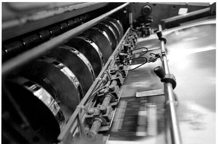
인쇄공장에서는 작업과 관련된 시간의 손실을 사전에 줄이는 것이 금전적으로나 실질적으로 효율을 높이는 것이다.