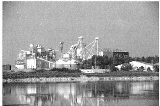
▲ (주) 케이씨피드 전경

그러나 이러한 국제곡물가격의 급변동에 대한 중장기적인 대응방안은 개별 사료회사의 현실적인 문제해결방법과는 다소 거리감이 있는 듯 합니다. 국제곡물가격의 급등락과 수급을 개별사료회사가 능동적으로 제어할 수 없는 현실을 받아들이고 이에 대응할 수 있는 방안이 있는지 확인하는 것이 더 중요하다고 생각합니다. 우리 회사에서는 흔히 공급선 다변화, 제품의 정밀설계,