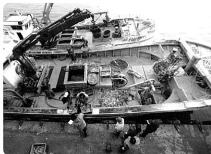
▲ 정치망어선 귀항