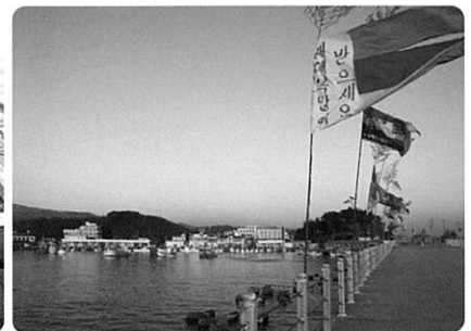
▲ 남애항 해맞이축제와 전경