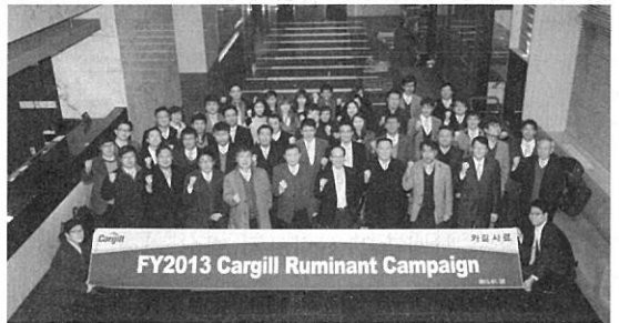
카길 축우캠페인 단체사진