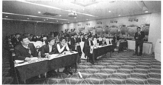
카길 축우캠페인 현장

카길사료는 이번 캠페인을 시발점으로 체계적인 사양 관리 프로그램을 정착시켜, 암소의 가치를 향상 시키고, 전방위 고급육과 낙농 시장을 공략하도록 고객 지원에 총력을 다할 것이다. 신제품 소개회, 육질 컨테스트, 비프텍 모바일 보급 등 다양한 고객 활동으로 이미 열기가 뜨거워지고 있다. 특히 이번에 스마트폰 전용 어플리케이션으로 서비스 되는 "카길 비프텍 모바일"은 번식우 전용 농장 관리 프로그램으로 농장의 각종 기록들을 실시간으로 기록하고, 체계적으로 분석할 수 있는 기존 비프텍 21을 업그레이드 하여 눈길을 끌고 있다.