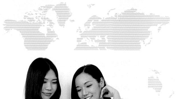
안드로이드폰이나 아이폰 등 고성능 스마트폰의 무선 랜이나 LTE를 이용한 고속무선통신망의 보급에 힘입어 스마트폰으로 인쇄물을 제작하고 발주할 수 있는 솔루션이 등장하기 시작했다.

저자는 2015년까지 약 3년을 기한으로 새로운 생각을 갖고 이를 실현하기 위해서 노력할 것을 촉구한다. QR코드를 활용해 인쇄물의 비용대비 효과를 측정, 평가, 보고하는 서비스를 활성화하고 확인 결과에 따라 높은 경쟁력을 갖는 서비스를 중심으로 고객에게 제안해야 한다고 지적한다. 인쇄물을 활용한 마케팅 효과를 최대한 이끌어 내기 위해서는 소셜미디어, 웹의 이용 및 제휴도 주저하면 안 된다고 강조한다. 물론 스마트폰이나 태블릿PC를 이용해 새로운 정보단말기로 인쇄물을 제작, 발주하는 것이 가능한 서비스도 제공할 것을 적극 추진해야 한다. (프라이드 레이더 야마시다 유리치로)