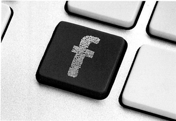
인쇄물을 활용한 마케팅 효과를 최대한 이끌어 내기 위해서는 소셜미디어, 웹의 이용 및 제휴도 주저하면 안 된다

끝으로 기업이 정신도 빼놓을 수 없다. 사실 궁극적으로 인쇄사에 게 필요한 것은 오너가 기업을 창업할 당시의 도전 정신을 갖는 것이 필요하다고 저자는 말한다. 저자는 현재의 인쇄사들은 과거에 양성했던 기업가 정신이 퇴색했다고 진단하고 이를 회복하는 것이 중요한 관건이 될 것이라고 지적했다.