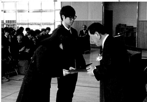
〈 입학식 장학금 전달 장면 〉

창녕제일고는 1951년 창녕농업고등학교로 개교한 63년 전통에 7천여명의 졸업생을 배출한 지역중심학교였으나 1990년에 자동차와 신설되고 2002년에 농과(원예과, 농업토목과)가 신입생 지원자가 없어 폐과가 되자 4만여평의 실습농장과 실험실습장, 고가의 기자재가 폐기되어야 할 상황이었다.