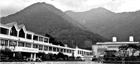
〈 창녕제일고등학교 전경 〉