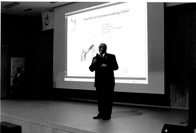
오전에 진행된 '글로벌 경쟁력 확보를 위한 국제표준화의 필요성' 특별 강연

국군인쇄창은 국방경영효율화 정책의 일환으로 2009년 7월 창설됨과 동시에 군 책임운영기관으로 지정된 바 있다. 2009년 통합 후, 창설 초기의 어려운 근무환경과 여건에도 불구하고 기관발전을 위한 5개년(2009~2013년) 중장기 발전 로드맵을 설정해 기관의 안정적인 운영과 내실화를 위한 단계적인 변화와 발전을 도모했으며, 이러한 환경을 토대로 2014년(2014~2018년) 이후 최고의 위상을 갖춘 기관 브랜드로 글로벌 인쇄출판기관으로 도약하기 위해 끝임 없이 노력하고 있다. 향후에도 민간분야와의 인쇄전자출판 분야의 상생발전을 도모함은 물론 국내 인쇄전자출판 분야의 발전을 위한 오픈이던터로서의 임무와 역할을 충실히 수행한다는 방침이다.☞