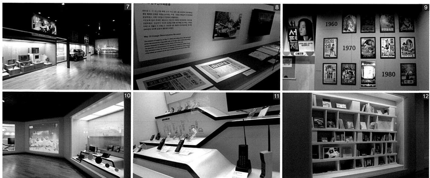
1. 1전시실 전경 2. 다양한 태극기. 왼쪽 태극기는 1890년경 사용된 데니태극기다. 3. 한글배본 (조선어강습소) 졸업장 4. 2전시실 전경 5. 1948년 8월 15일 대한민국 정부수립기념식 자료 6. 1950년대 시발자동차 7. 3전시실 전경 8. 5·18광주민주화운동 관련 유물 9. 1960~70년대 영화포스터 10. 4전시실 전경 11. 국내 최초 휴대전화를 비롯한 각종 휴대폰 12. 한국문화와 한국학자료들

제4전시실은 대한민국의 선진화, 세계로의 도약이라는 주제 아래 세계로 나가는 대한민국, 경제선진국을 향하여, 대한민국의 미래 등으로 구분해 전시하고 있다. 1988년부터 현재까지 더 큰 대한민국으로 도약하는 우리의 모습과 미래비전을 제시하고 있다. 주요 유물로는 국내 최초 개발 휴대전화, 서울올림픽 공식 마스코트 호돌이, 세계 최초로 개발된 반도체 등이 있다.