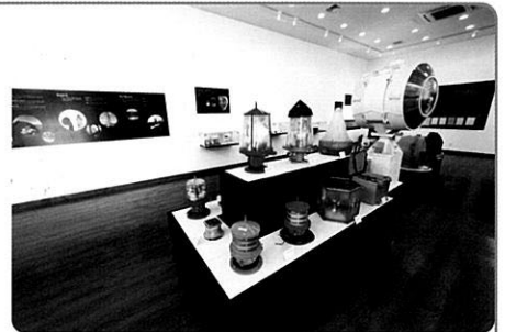
▲ 가덕도 등대박물관

열댓 명의 어업인들이 바다 위에 떠있는 여섯 척의 어선에 긴장된 표정으로 포진하고 있다. 이윽고 산꼭대기 망루에서 어로장이 '그물들라!'는 고함이 터져 나온다. 여섯 어선의 어업인들과 함께 망루에서도 그물을 당기기 시작하더니 순식간에 송어떼를 그물 속에 가둔다. 대항마을, 송어 잘 잡기로 소문난 어업인들이 사는 가덕도의 한 어촌이다. 한꺼번에 몇 백, 몇 천 마리씩 송어를 잡아내는 대항마을 육소장망은 국내에서 유일한 전통어업으로 160년이 넘게 이어져왔다.