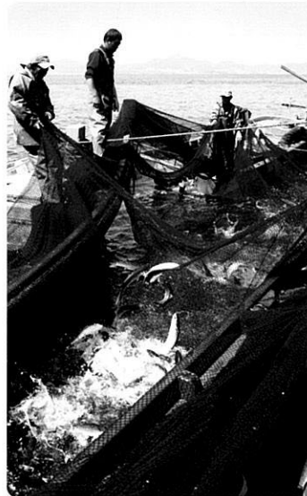
▲ 대항어촌체험마을 송어잡이

● 문의: 대항어촌체험마을 ( http://daehang.seantour.com ) 051-972-3369