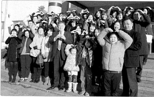
해 공장 견학과 함께 제품을 둘러보는 시간을 마련했다.