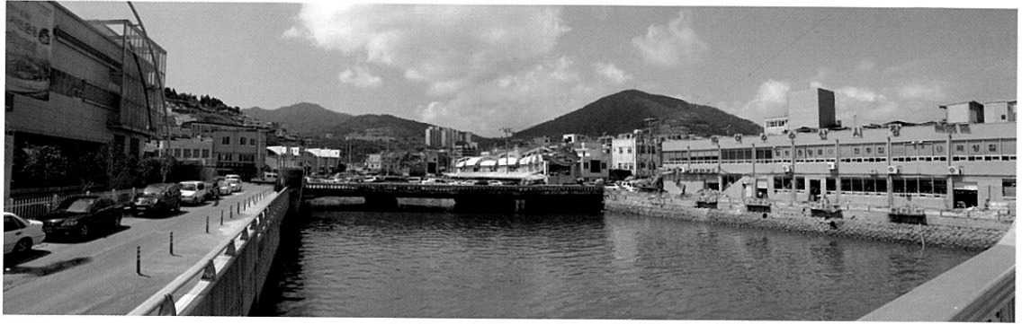
강과 나란히 들어선 여수시점(사진의 오른쪽)

덩이에서는 혼자일 뿐이다. 결국 인생은 '더불어 홀로 걷는 여행'이다. 이럴 때 나를 위로해줄 수 있는 무언가는, 한잔의 술. 흥청망청 어지러이 마시는 술이 아닌, 혼자서 또는 삼삼오오 벗들과 오붓하게 마시는 한잔의 술. 오늘은 스산한 겨울의 끝자락을 잡으며, 운치 있게 한잔 술이 있는 강의 풍경 속으로 헤엄쳐 가보자.