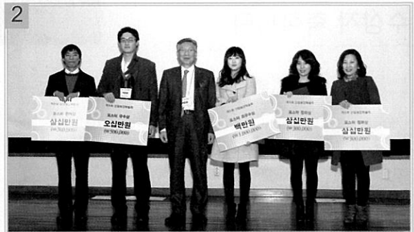
1. 산업보건 우수사례 포스터 세션 장면 2. 산업보건 우수사례 포스터 부문 수상자들