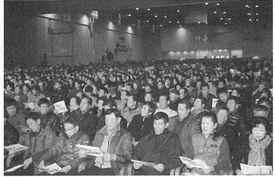
빈 자리가 없을 정도로 가득 메운 축산인파