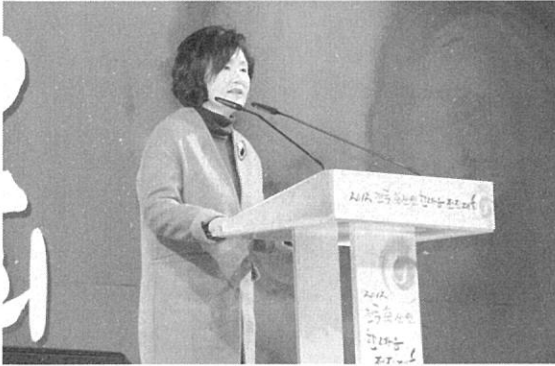
문재인 전 민주당통합당 대통령 후보 부인 김정숙 여사가 문 전후보를 대신해 초청발언을 하였다