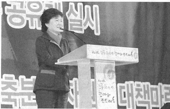
자신의 공약을 전하고 있는 박근혜 당선인