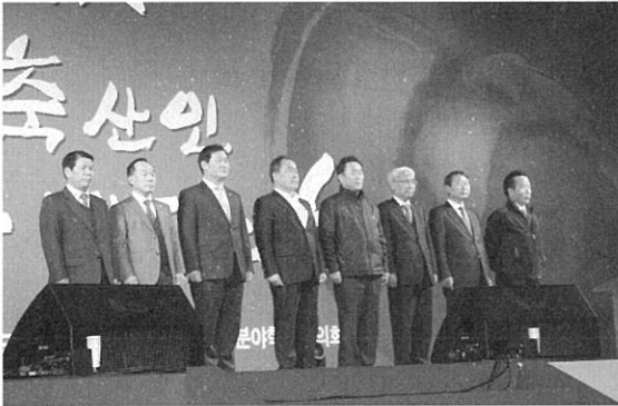
축산관련단체협의회 회원단체장 및 공동개최단체장