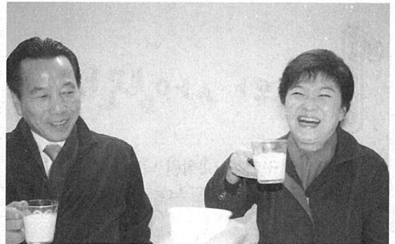
공식 행사에 축산인 대표들과 박근혜 당선인과의 만남자리에서 우유 건배를 하는 박 당선인과 이승호 축산관련단체협의회회장