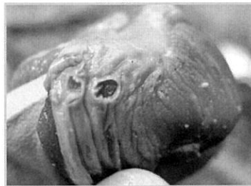
〈사진 2〉 근위 궤양