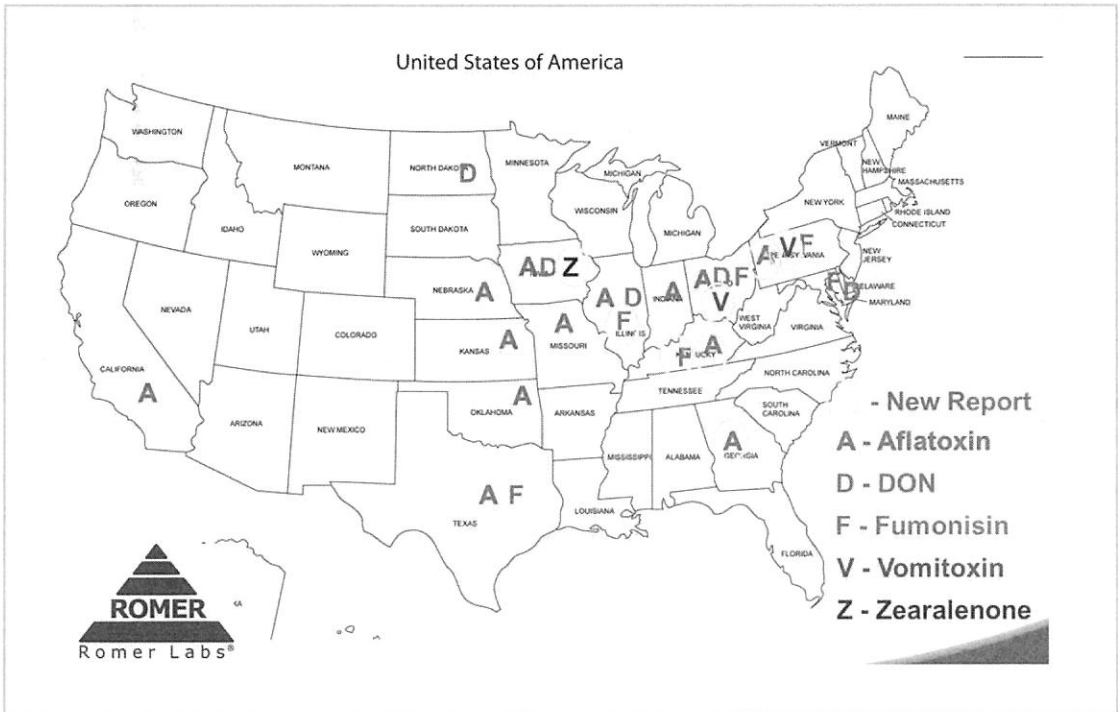
<그림 1> 미국내 곰팡이독소 검출 현황 - 2012년 11월

2012년 수확한 옥수수에 대해 미국의 한 연구기관에서 곰팡이 독소검출에 대해 샘플링을 실시했다. 여러 지역에서 다양한 종류의 곰팡이독소가 검출된 결과를 <그림 1>을 보고 알 수 있다.