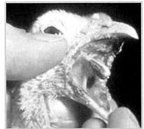
〈사진 3〉 구강 병변