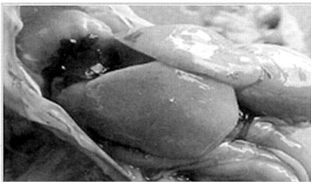
〈사진 1〉 아플라톡신에 감염된 간

그러나 이런 곰팡이독소의 진단이 매우 어렵다는 점이다. 임상증상이 의심스럽기는 해도 결정적인 진단을 하기가 매우 드물다. 또한 곰팡이가 사료내의 균데균데에 분포하기 때문에 독소가 없는 부분을 채취하여 검사하면 검출될 확률이 낮아진다. 독소의 영향이