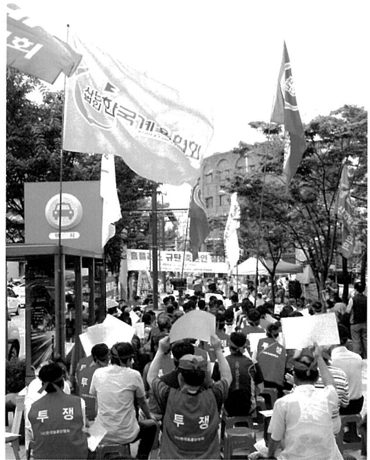
지난 7월 22일 홈플러스 강동점앞에서 수입닭고기 판매 저지 집회가 열렸다.

아울러 소비자에게 '합리적인 소비'에 대한 그릇된 관념을 심어줄 수 있다. 품질에 대한 변별력이 크지 않다고 착각하는 소비자의 경우 가격만으로 '값 싸게 원하는 닭고기(?)를