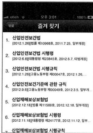
<그림 4> 즐겨찾기에 등록된 법령 예