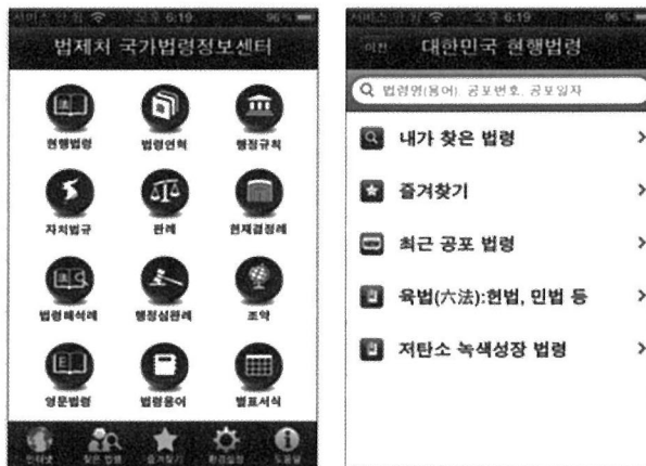
<그림 3> 주 메뉴 및 현행법령메뉴

법령검색은 주제어, 공포번호, 공포일자 등으로 가능하며, 법령이 공포되는 즉시 업데이트된다. 특히 즐겨찾기로 지정할 경우, 인터넷 접속이 불가능한 지역에서도 자주 찾아보는 법령을 확인할 수 있어, 중소기업사업체를 방문하는 경우와 같이, 자체 저장장치를 이용할 수밖에 없는 경우에도 활용이 가능하다.