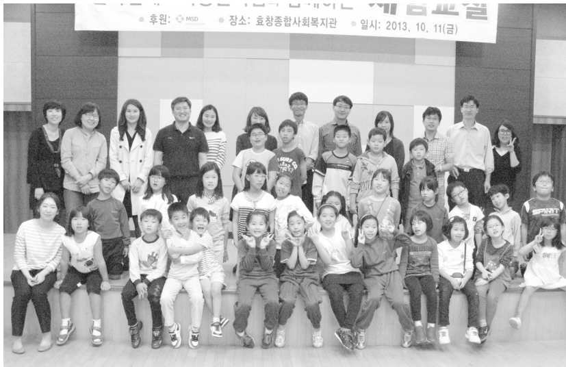
▲ 복지관 봉사활동

회씩 매 학기마다 전국에 위치한 10개 수의과 대학을 대상으로 우수 학생들을 선발해 장학금을 수여하고 있다. 미래의 수의축산업에 이끌어 나갈 학생들에게 장학금을 지원하여 수의사로서의 꿈을 키워갈 수 있도록 도움을 주고 있다. 또한, 2012년부터 진행해온 ‘한국엠에스디동물약품(주) 그림·시 공모전’은 수의축산 관련 분야에 종사하고 있는 분들의 초등학생 자녀들을 대상으로 매년 봄에 공모전을 개최하고 있다. 아이들이 동물을 직접 그려보고 상상하며 다양한 수의축산 업계에 종사하는 부모님께 존경심과 애정을 표현할 수 있는 기회를 제공하며 어린이들에게 동물과 자연을 아끼고 사랑하는 마음을 키울 수 있는 장을 마련하고 있다. 더불어 임직원들은 매년 하반기에 자원봉사 활동을 진행하고 있다. 서울 소재 사회복지관 등에서 저소득층 아이들과 함께 강정이나 떡 만들기 등과