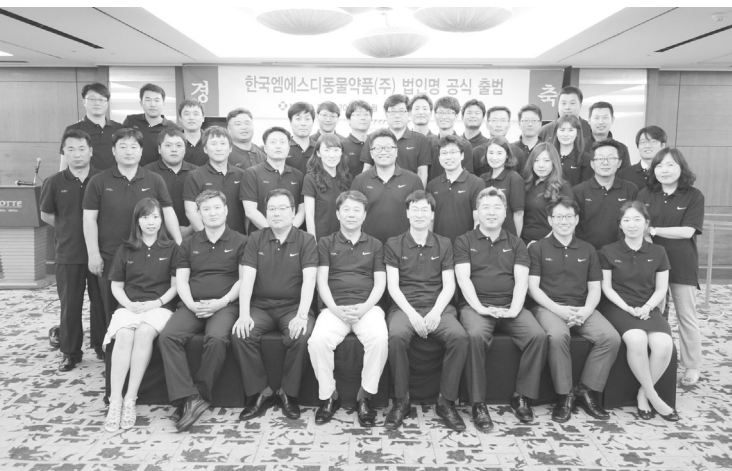
▲ 한국엠에스디동물약품(주) 공식 출범식

한국엠에스디동물약품(주)는 다양한 나눔활동으로 사회적 기업으로 성장하고 있다. 1년에 2