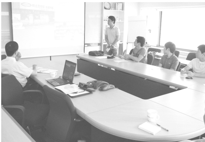
▲ 수의과대학생 하계 인턴십