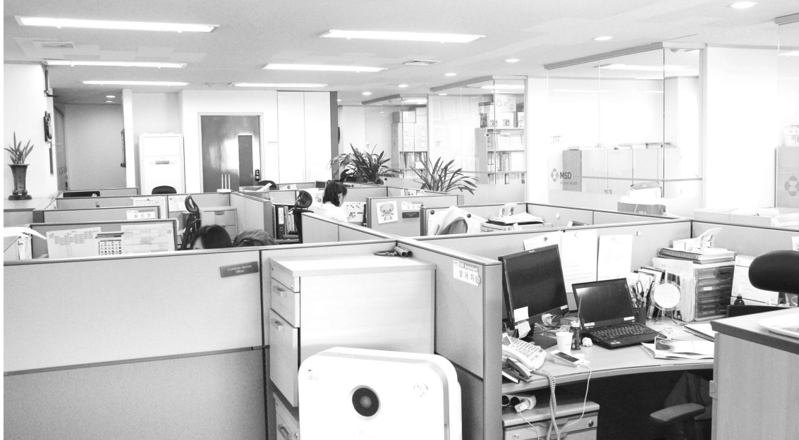
▲ 서울사무소 내부