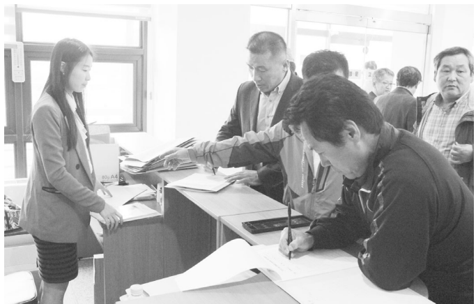
▲ 교육 참가자들이 등록을 하고 있는 모습