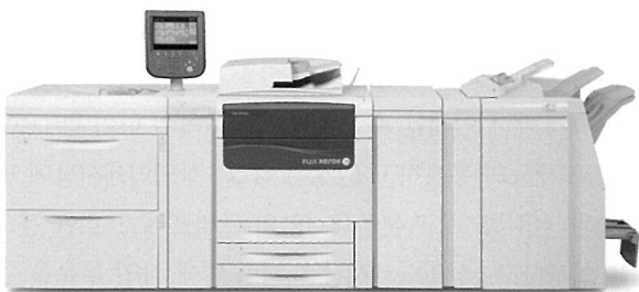
ACQS를 탑재한 컬러 J75 프레스

한편 'PS 컬러 페어 2013' 행사 마지막 순서로 신제품을 계약한 동진문화사(대표 이병무)를 비롯한 총 4개의 인쇄사 고객과의 사인오프 행사가 진행됐다.☺