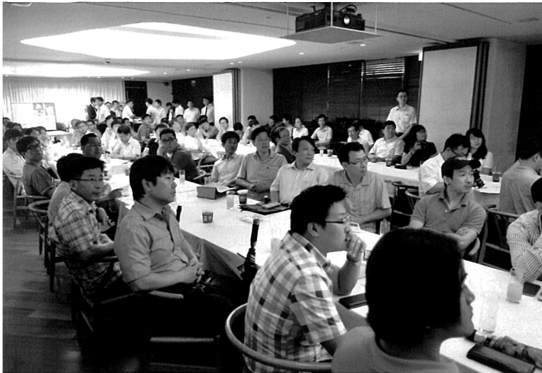
호텔PJ에서 열린 'PS컬러페어'에 참가한 인쇄인들