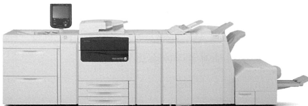
작동법을 간소화한 컬러 C75 프레스