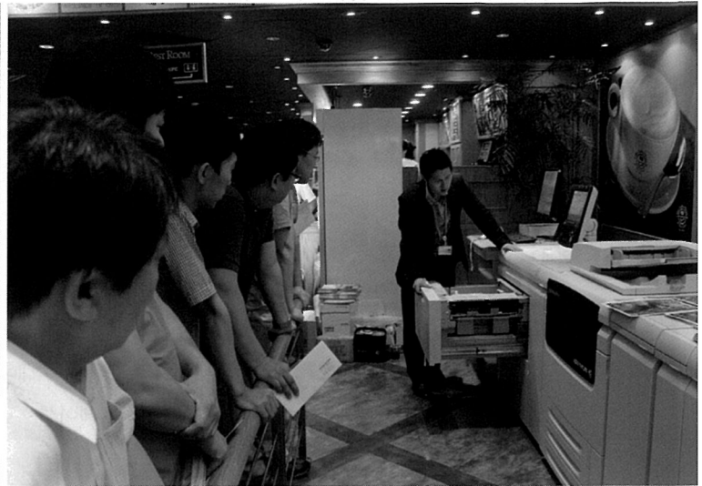
같은 날 충무로에서 진행된 로드쇼