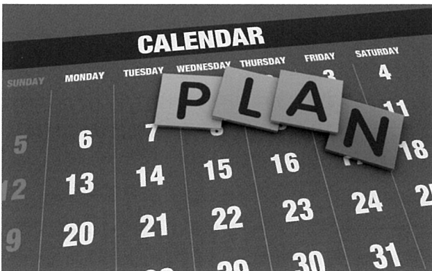
프로젝트를 진행할 때는 각각의 공정별 시간계획표를 구체적으로 짤 필요가 있다.