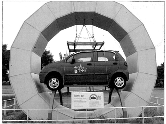
1kW의 힘 자동차 한대를 들 수 있는 에너지

서울에너지드림센터의 에너지 활용을 알고 나서는 감탄을 금할 수가 없었다. 에너지 제로에 도전하는 운영에 앞으로 많은 건축물들의 바로미터가 되었으면 하는 생각도 들었지만, 이런 신재생에너지의 사용과 운영에는 아직 기반시설이나