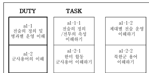
<표 5> 직무모형(예)

직무의 정의에서 도출된 것을 기초로 아래 표 5처럼 Job에 따른 Duty 설정과 Task를 분류하여 직무 모형을 작성한다.