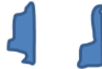
그림 5. 4자의 x-y 프로젝션 Fig. 5. x-y Projection of Number 4

위의 그림 4에서 알 수 있듯이 y축으로 프로젝션을 수행하면 숫자를 각각 구분할 수 있고 일정한 픽셀 값을 얻을 수 있으며, x축으로 프로젝션하면 각 숫자에 대한 픽셀 값을 얻을 수 있다. 그림에서는 4자가 x-y 프로젝션을 수행하여 완전히 분리되고 4라는 값을 얻을 수 있다. 다음 그림 5는 4자에 대한 x-y 프로젝션 도형을 나타낸다.