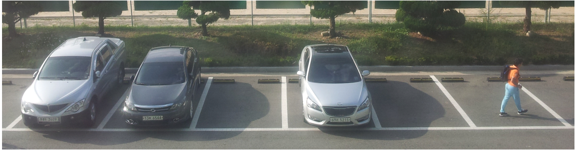
그림 2. 1대의 카메라 촬영 영상 Fig. 2. Video Shot with One Camera