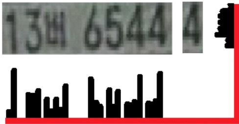
그림 4. x-y 방향 프로젝션 Fig. 4. Projection x-y Direction

본 논문에서는 차량 번호판 인식은 [17]에서 제시하는 x-y 방향 프로젝션에 의한 문자의 인식으로 수행하는데, 숫자의 인식은 다음과 같이 수행된다.