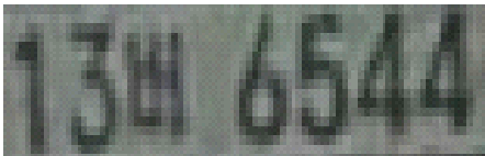
그림 3. 차량 번호판 Fig. 3. Car License Plate

본 논문에서는 차량 번호판 인식은 [17]에서 제시하는 x-y 방향 프로젝션에 의한 문자의 인식으로 수행하는데, 숫자의 인식은 다음과 같이 수행된다.