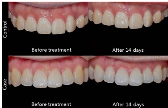
Fig. 3. Color changes between groups after 14 days by images

(Fig. 3)은 미백 전과 미백 14일 후의 상악 전치부 치아를 디지털 카메라로 촬영한 사진이다. 대조군에서는 미백 전과 미백 14일 후 색조 변화가 없는 모습을 보였으나 실험군에서는 미백 전과 비교하여 미백 14일 후에 육안으로 인지할 수 있을 정도의 색조 변화를 확인할 수 있었다.