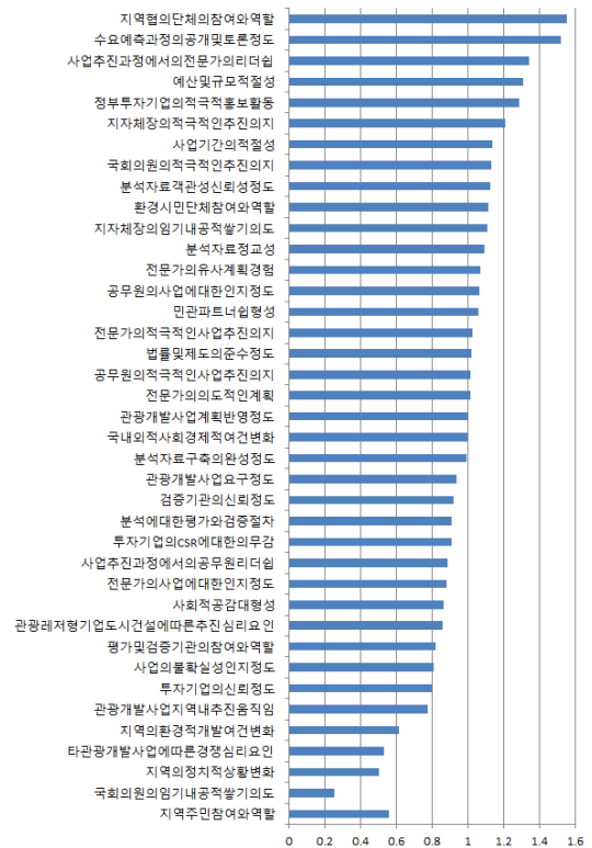
그림 3. 중요도 분석 결과

었는데 이는 대규모 관광개발사업에 활성화를 위한 민관 파트너십이 수반되어야 함을 시사해 주는 것이다. 마지막으로 계획 및 검증 부분에서의 경우 분석방법 특성에서 수요예측과정의 공개 및 토론정도(1.519)가 중요한 요인으로 도출되었으며 이는 전체요인들 중 두 번째로 중요한 요인으로 나타났다.