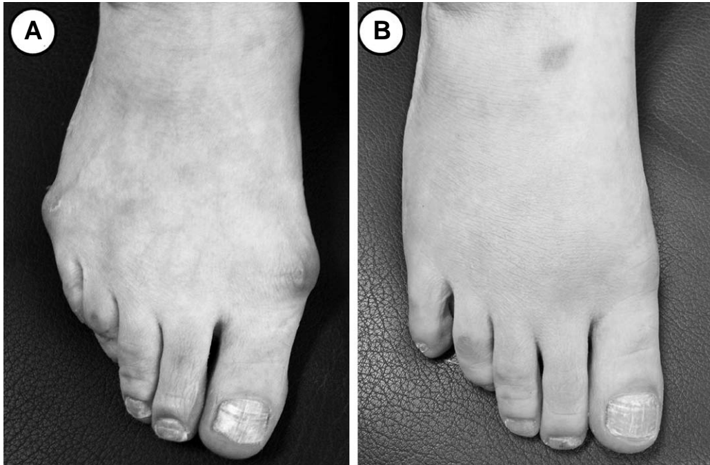
Figure 3. (A) Preoperative photograph of 48 years old female patient shows bunionette concomitant with hallux valgus. (B) Postoperative photographs showing the satisfactory deformity correction.

방사선 검사 상 제 2 중족골 두 관절면 최첨부의 높이가 제 1 중족골 두 최첨부보다 12 mm 이상 긴 경우에는 중