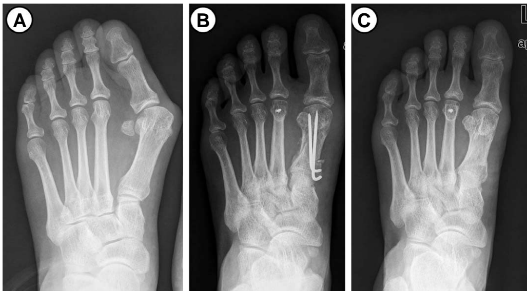
Figure 2. (A) Preoperative radiograph of 52 years old female patient shows a severe hallux valgus deformity and relatively long 2 nd metatarsus. (B) Postoperative radiograph showing the proximal chevron osteotomy and the Weil osteotomy. (C) Last follow-up radiograph shows the good alignment of forefoot.