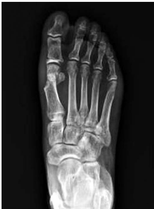
Figure 2. At the postoperative 12 months, anteroposterior radiograph shows a radiolucent line of the osteotomy site.

방사선 소견 상 2례에서 불완전 골유합으로 보이는 절골면의 방사선 투과성 음영이 발견되었으나 이는 절골면의 내측 1/3정도에만 걸쳐 있었으며, 술 후 3개월 시점부터 절골면의 동통이나 압통은 존재하지 않는 상태로 부분적인 골유합으로 생각하였다(Fig. 2). 그 외 전 례에서 완전 골유합을 보였으며, 단 1례에서도 고정력 약화로 인한 절골면의 벌어짐이나 각도의 소실은 없었다. 술전 VAS 동통점수가 6.5점(4~8점)에서 술 후 0.6점(0~3점)으로 유의하게 감소하였으며( p < 0.05 ), AOFAS 척도는 술 전 평균 44.6에서 술 후 12개월 시점에서 평균 87.6으로 향상되었다(Table 1). 피부자극 및 염증소견 등의 합병증은 관찰할 수 없었고 봉합사가 통과한 중족지절 관절부위에서도 어떠한 불편감이나 통증도 발생하지 않았다.