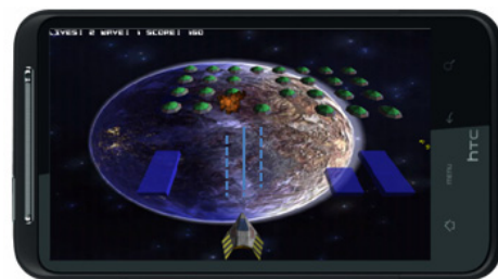
Figure 2. Game's screenshot for experiment

한편, 객관적 쾌락적 만족도를 측정하기 위해 우주선이 가능한 오래 생존하도록 게임에 집중할 것을 피실험자에게 요구하였다. 실험 후 설문지(Appendix A)를 이용하여 피실험자의 다양한 쾌락적 만족도를 측정하였다. 피실험자마다 3라운드의 게임을 실시하였으며, 실험 중 모든 게임은 무음으로 진행하였다. 또한 진동소음과 기타 외부 소음에 따른 영향을 최소화하기 위하여 소음제거 헤드폰을 착용하도록 하였다.