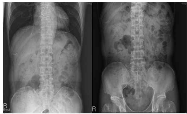
Fig. 3. Abdominal x-ray after 3 days. The foreign body was not seen any more.