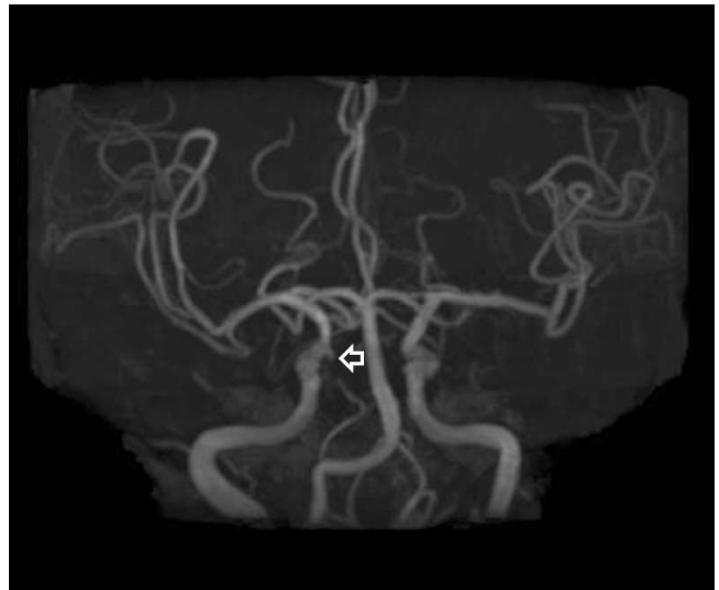
Fig. 2. Brain TOF (time-of flight ) MR angiography shows about 2 mm sized small aneurysm of the right paraclinoid internal carotid artery (arrow).

전환추동맥의 주행은 제1형의 경우 내경 또는 외경동맥에서 기시하여 바깥쪽 및 등쪽으로 주행하여, 환추-후두 부위