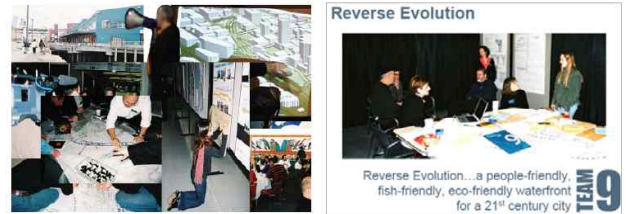
<그림 2> 도심 수변공간 계획을 위해 2004년에 개최된 디자인샤레트 (www.seattle.gov)

근린생활권 등의 측면에서 개인적인 의견을 제안하고 공감대를 형성하였다. 이후 디자인샤레트에서 도출된 아이디어의 검토목록을 활용하여 공공디자인의 선적연결, 주요지점간의 연계, 남북 주요 지점의 선적 연결을 통해 중심부와 연계 등 세 가지 기본 개념을 도출하였다. 13)