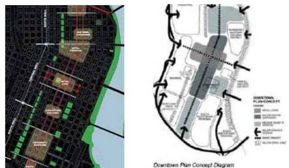
<그림 3> 트랜짓몰 개념도(Downtown Plan, 1972)

트랜짓몰은 포틀랜드시의 보행자 중심의 도심지를 조성하기 위해 장기적으로 대중교통체계를 마련하고자 하는 계획이다. 현재 트랜짓몰의 계획은 실무 전문가 중심으로 구성된 도시디자인그룹이 주관하여 사업의 물리적인 계획을 주도하는 도시계획국과 개발사업의 비물리적인 측면에서의 계획을 보조하는 개발국 사이의 상호협약(MOU: Memorandum of Understanding)의 체결로 진행된다. 도시디자인그룹은 민간부문에서 도시설계를 수행하던 도시설계전문가 5명으로 구성되어 있으며 대상지의 역사, 현황, 중점과제들을 사전조사를 통해 수행하고 현황도면을 작성하며 교통, 녹지, 주거환경 등 관련된 계획 및 다양한 요소들을 중첩하여 대상지에 관한 전문적인 검토를 통해 기본 계획안을 작성하고 과거의 계획안에 대한 검토와 역사적인 변화를 고려한다. 도시디자인그룹은 자체적으로 구축된 계획안을 협의 시스템의 기본 자료로 활용하고 도시디자인그룹을 주축로 다른 부서와의 협업을 조정하여 사업을 추진한다. 뿐만 아니라 3개 권역과 7개 지역을 대상으로 세부적인 디자인 계획을 수립한다. 트랜짓몰 재정비 계획은 실무전문가 중심의 디자