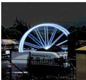
<그림 4> Allendale industrial heritage water wheel 계획, (Dott Project, 2007)

Dott(Design of the time) 프로젝트는 2007년부터 디자인카운슬(Design Council) 14) 의 주요사업의 하나로 시민의 참여를 통한 디자인을 개발하기 위한 시민참여형 공공디자인 정책이다. Dott 프로젝트는 2007년 북동지역에서 첫 프로젝트를 시작으로 매 시기별 지역을 변경하여 디자인캠프 형식으로 추진한다. 특히 현지 이용자와 유명 디자이너, 디자인 전문업체가 프로젝트별로 참여해 일반시민의 창조적 사고를 구체화하고 시각화하도록 지원하는 Co-Design의 프로세스를 활용한다. 프로젝트의 주제는 Vital Sign, Energy, Health, Food, Movement, School& Schooling으로 분류되어 각 캠프에 참여한 인원은 6가지의 핵심테마를 중심으로 장소에 대해 고민하고 주제에 부합하는 디자인 개선 아이디어를 수렴하고 대안을 제시한다. 핵심테마는 공공디자인커미션, 교육프로그램, 디자인 쇼케이스 등의 세부 프로그램으로 운영된다. 공공디자인커미션은 디자이너 및 시민과의 파트너십으로 사회적 문제의 개선에 관하여 지역의 해당기관과 시민들이 함께 디자인하는 프로그램으로 Dott프로젝트에서는 아래의 <그림 4, 5>와 같이 캠프의 장소와 주제에 따라 필요한 공공디자인을 직접 제안한다. 또한 교육프로그램으로는 디자인을 교육에 적용하는 프로그램으로 학교장과 대학생, 교사 등이 디자인 개선과 관련하여 참여하게 된다. 마지막으로 디자인 쇼케이스는 각종 행사와 전시회를 통해 우수한 디자인을 해당지역에 도입하고 다양한 형식 및 이벤트로 시민들에게 디자인을 이해하는 기회를 제공한다. 15) 또한 개발된 디자인 안들은 관련된 기획자와 연계하여 디자인을 진행하도록 지원하며, 각 기획자의 홈페이지를 통