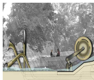
<그림 5> Northumberland small scale water mill계획, (Dott Project, 2007)