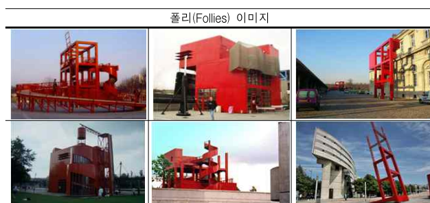
<표 5> 라 빌레트 공원(Park de la Villette paris, Bernard Tschumi, 1987-91)

즉, 주체로서의 사용자의 개념은 경험의 복합성과 시간성을 바탕으로 시시때때 일어나는 예측 가능한 혹은, 예측 불가능한 사건들 속에서 공간의 주체로 생성되어 새로운 공간을 구축하는 행위의 주체로서 확장되기 시작했다.