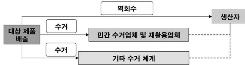
그림 1. 자발적 협약대상제품의 선정기준으로 배출된 폐기물의 수거경로

둘째, 재활용 기술과 재활용률의 기준이다. 자발적 협약 대상 품목으로 선정되기 위해서는 재활용률이나 수거율 또는 출고량 대비 발생 비율과 같은 재활용 관련 통계와 재활용 기술의 존재, 재활용 용도나 기술 현황, 재활용업체 현황 등이 제시되어야 한다. 재활용률 현황은 기존 재활용 의무율을 설정하기 위한 기초 자료로 활용되며 재활용업체 현황은 실제 재활용 달성 여부를 점검 또는 확인하기 위해서 필요하다. 자발적 협약 대상 품목은 기술적으로 재활용이 가능한 제품임이 증명되어야 하며, 재활용 용도는 물질 재활용의 방법을 통해再生资源 및 타제품의 원료를 생산하는 경우로 한다. 또한 일반 소각이 아닌 RPF(플라스틱 고형연료)를 생산해 연료로서 재활용한 실적에 한해서는 에너지회수 용도로의 활용을 제한적으로 인정할 수 있다.