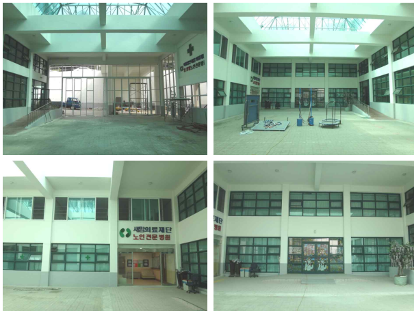
그림 3. 대상병원계획지 아트리움 사진

규모는 122병동으로 장기입원의 경우 노인성질환, 불치병환자, 말기 암환자와 같이 장기요양이 필요한 자가 대상자이며, 단기입원의 경우 일상생활은 가능하나 보호자의 사정으로 단기간의 입원 및 보호가 필요한 환자를 대상으로 양·한방의 의료서비스를 지원하고 있다.